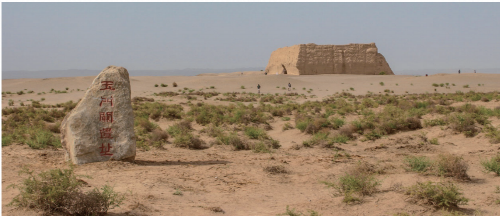
图 7-1-1 玉门关遗址

讲述：《凉州词二首·其一》（以下简称《凉州词》）是唐代诗人王之涣的七言绝句，也是唐代边塞诗的代表作品之一。“黄河远上白云间，一片孤城万仞山。羌笛何须怨杨柳，春风不度玉门关。”诗歌说的是：黄河好像从白云间奔流而来，玉门关孤独地耸峙在高山中。何必用羌笛吹起那哀怨的杨柳曲，去埋怨春光迟迟不来呢，原来玉门关一带春风是吹不到的啊！（图 7-1-1）