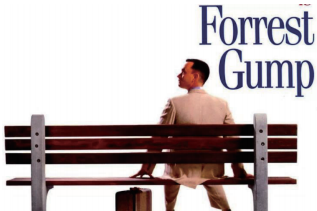
图 7-2-1 电影《阿甘正传》宣传画

讲述：当母亲躺在病床上，人生即将走到终点时仍然在鼓励阿甘实现自己的命运，阿甘问道：“我的命运是什么？”母亲微笑着说：“人生就像一盒巧克力，你永远不知道下一块将会是哪一种。”面对阿甘的疑问，母亲没有正面回答，而是通过生活中常见的形象做比喻，又把这个人人生终极问题推给了广大的观众来思考和细细品味其中复杂的意蕴。不管是多少次，每当放映《阿甘正传》（图 7-2-1）时，我们总会被电影主人公阿甘正直的个性和单纯的初心所打动。多年来影片中简洁而又不时透出深刻哲理的人物语言给一代又一代影迷留下了深刻的印象，值得我们静下心来回味。