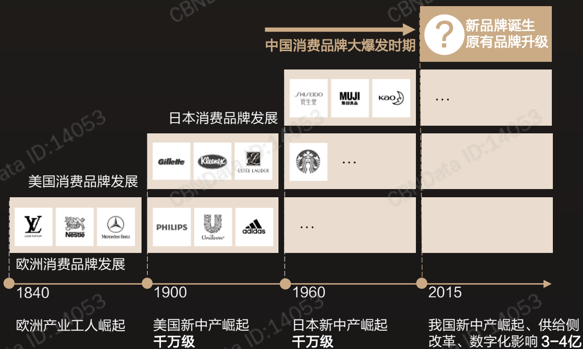
全球消费品品牌发展历程

据麦肯锡预计，到2023年中国将贡献全球消费增量的30%。国人消费力的崛起带动消费品牌进入大爆发时期，2019年线上新增新品牌数量增长至2017年的2.49倍。