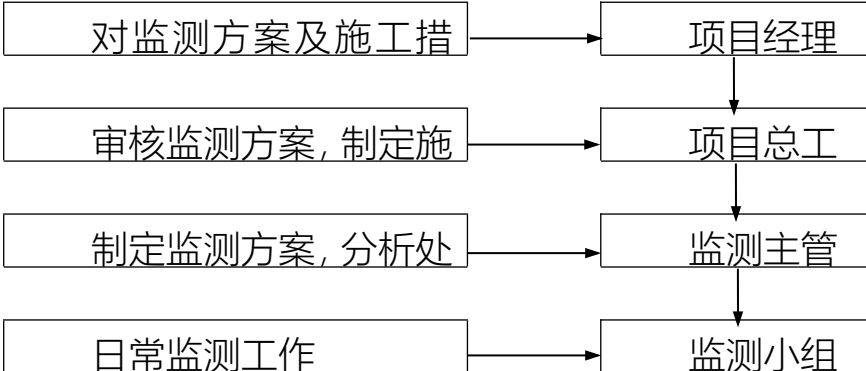
图 5.2-1 监控量测组织结构图

针对本工程监测项目的特点成立专业监控量测管理机构，由我单位派驻现场 4 人组成监控量测及反馈信息小组，成员由多年从事地下工程施工及监测经验的技术人员组成，组长由具有丰富施工经验，具有较高结构分析和计算能力的工程师担任。并且由项目经理、项目总工对监测方案及施工对策进行审核。监测小组设一名专项负责人，在监测主管的领导下负责地面和地下的日常监测工作及资料整理工作。监控量测组织机构详见图 5.2-1。