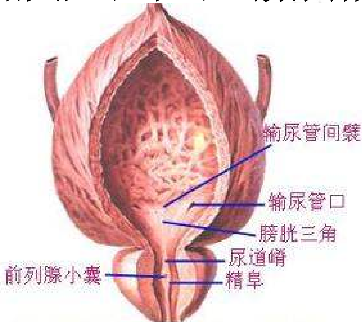
膀胱及男性尿道前列腺布（前面观）