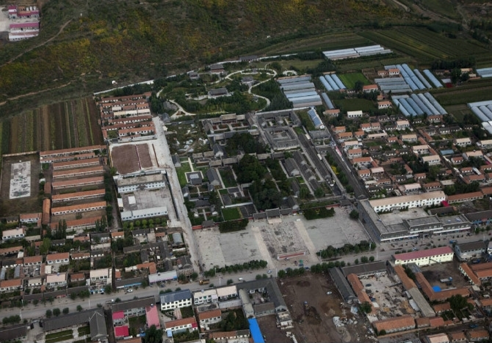
喀喇沁亲王府 (原图无修无裁)