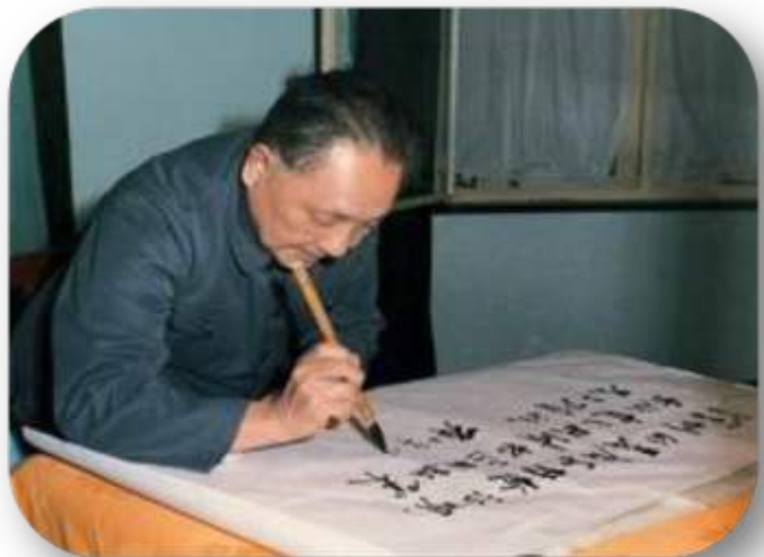
1984年邓小平为深圳经济特区题词

深圳的发展和经验证明， 我们建立经济特区的政策 是正确的。 邓小平 一九八四年六月