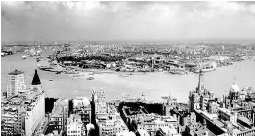
1990年以前的上海浦东