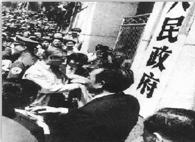
1988年4月，中央批准 海南建省和经济特区