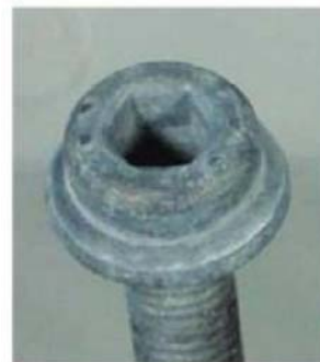
b) 1000 h中性盐雾试验(NSS)后