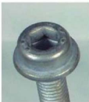
a) 72 h中性盐雾试验(NSS)后

测试期间，白雾可能会随着时间的推移而增加[见图A.1 b)]。白雾量少，在潮湿状态下不可见，仅在干燥状态下可见，见图 A.2。