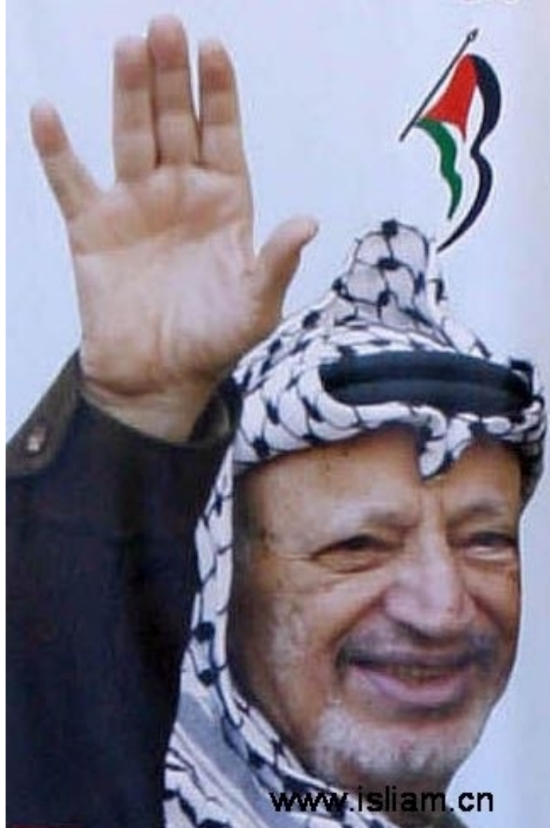
亚西尔·阿拉法特 155cm (巴勒斯坦领袖)