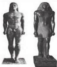
▲ 古代希腊和埃及的雕刻

古代世界各地区的经贸往来，以及思想、文化和技术的传播是文明交流的重要表现，促进了文明的发展。