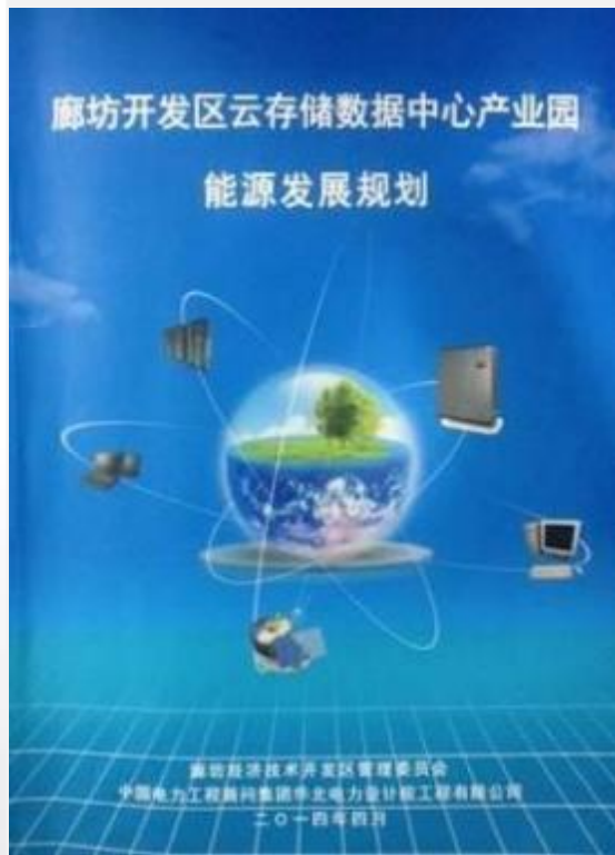
《廊坊开发区云存储数据中心产业园能源发展规划》