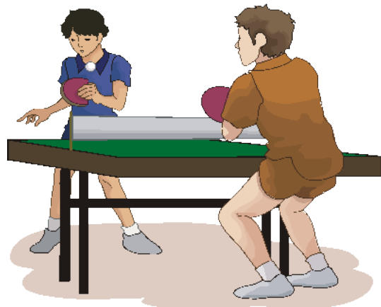
play table tennis