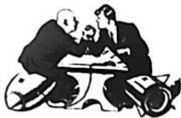
图2 美苏的“较量”：古巴导弹危机