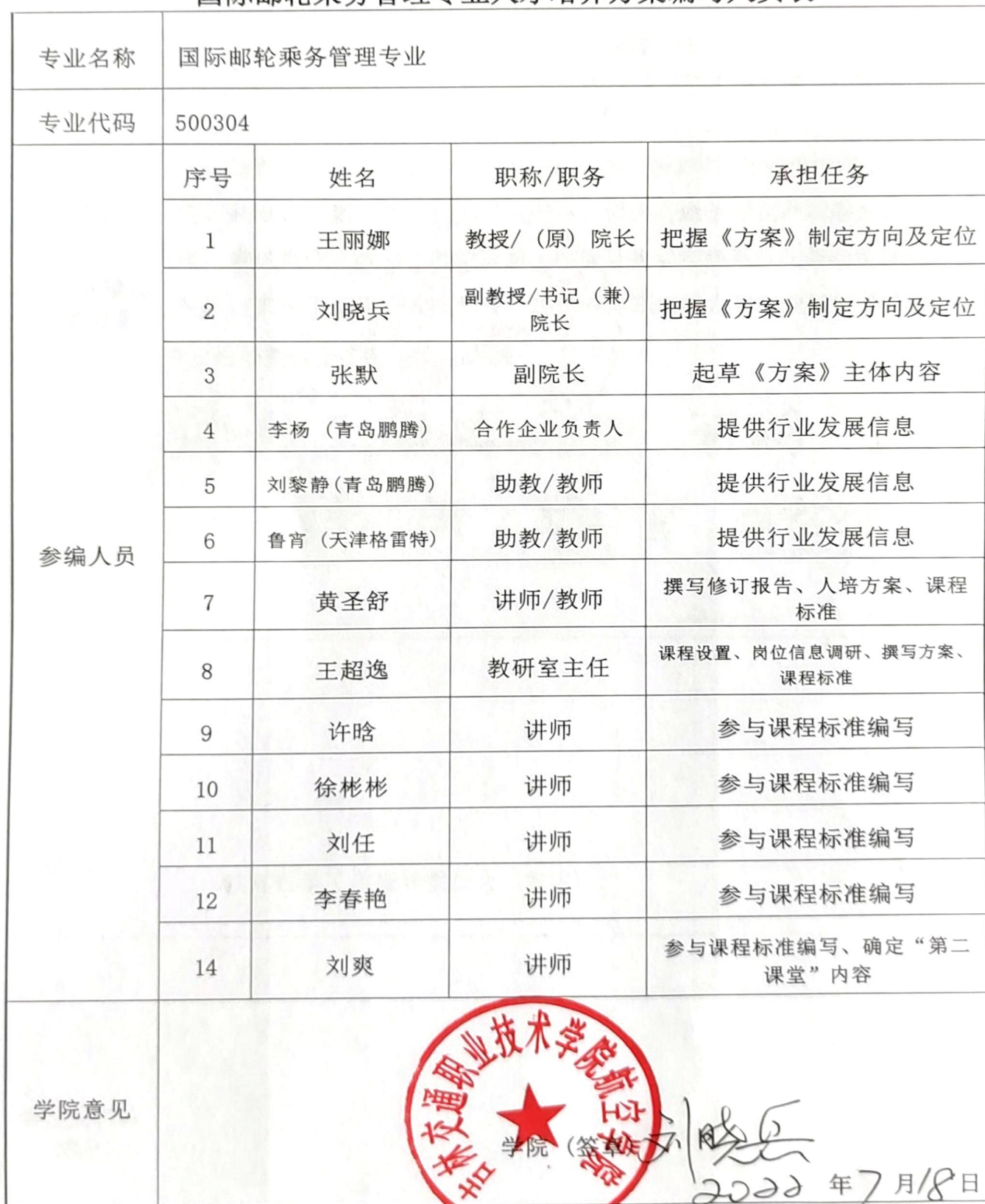
吉林交通职业技术学院 国际邮轮乘务管理专业人才培养方案编写人员表