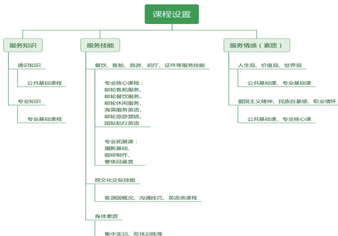
表 7 专业课程体系

本专业以职业能力为主线，深入分析岗位需求，将学生必备的服务知识、服务技能和服务情感融入公共基础课、专业基础课和专业核心课中，根据能力培养要求进行模块化课程设置。分为公共基础平台课程、专业模块课程、集中实践、第二课堂四大板块，旨在保证学生的全面发展、夯实职业技能、重点培养实践能力、拓展学生就业和社会服务能力、提升学生的创新精神和解决问题能力。