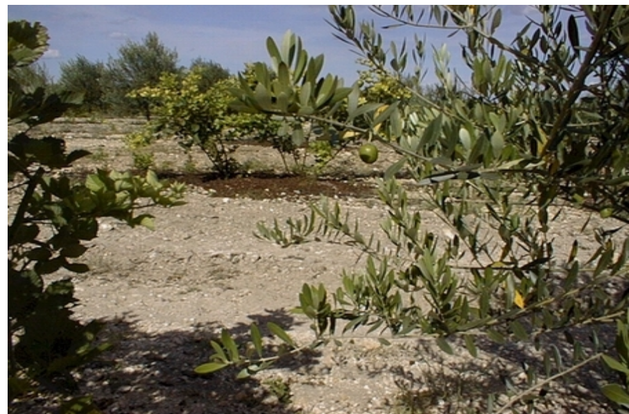
地中海地区的油橄榄