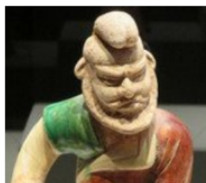
唐代胡人俑（甘肃庆城穆泰墓出土）

君不闻胡笳声最悲，紫髯绿眼胡人吹。 ——岑参《胡笳歌送颜真卿使赴河陇》 铁马长鸣不知数，胡人高鼻动成群。 ——杜甫《黄河》 紫髯深目两胡儿，鼓舞跳梁前致辞。 ——白居易《西凉伎》