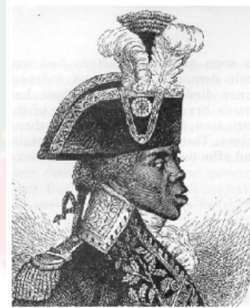
海地革命领袖 杜桑·卢威杜尔