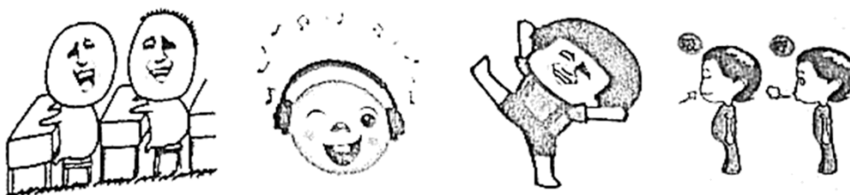
个人情绪调整常用方法举例