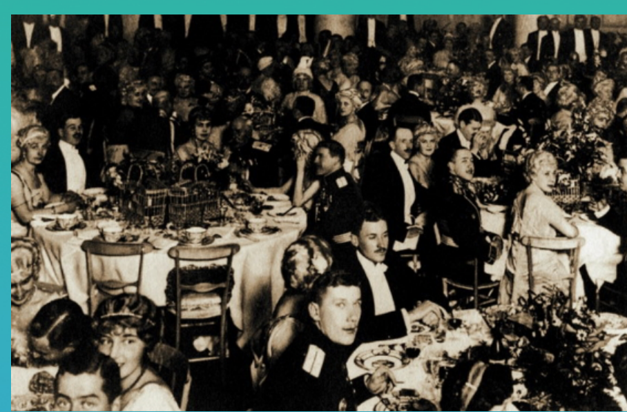
上流社会举行的豪华酒宴