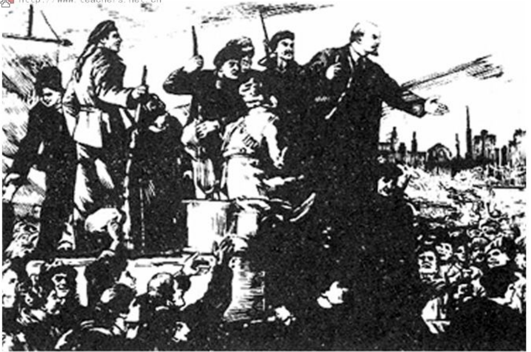
列宁回到彼得格勒