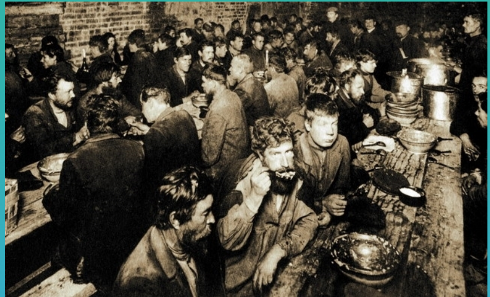
穷人在施粥棚内勉强果腹