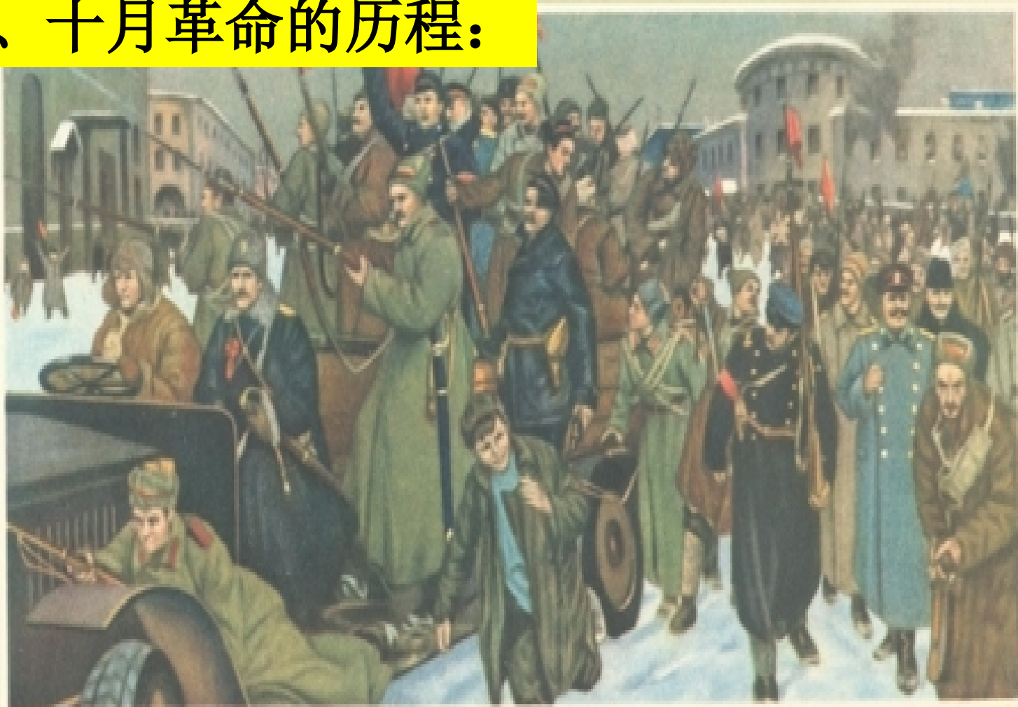
二月革命的彼得格勒