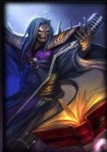
五杀摇滚主唱 卡尔萨斯