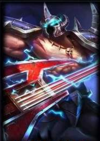
五杀摇滚吉他手 莫德凯撒