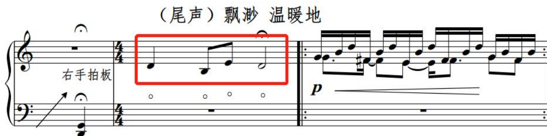
谱例 2-7: 《晓雾》尾声

最后, 尾声部分运用了古筝泛音的演奏技法将乐曲的主题动机重新呈现(谱例 2-7), 使乐曲从热闹的、活跃的回归到安静、飘渺、温暖的音乐形象, 为后续引子材料的变化再现段做好铺垫, 加强了古筝音乐的感染力。