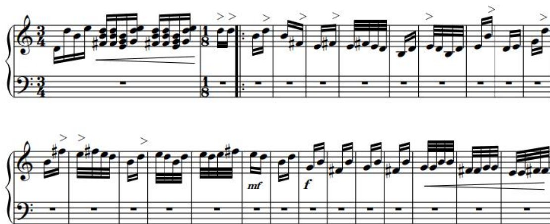
谱例 2-13: 《晓雾》第 61-89 小节