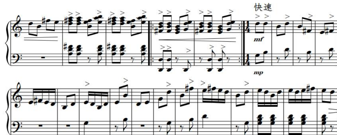
谱例 2-14: 《晓雾》第 148-205 小节

第 148-205 小节是乐曲的第二个插部结构(谱例 2-14), 采用了 1/4 拍的节奏, 与第一个插部结构相类似, 同样围绕着主题旋律展开, 与此同时, 该插部还运用了京剧中的西皮流水板, 从而使旋律变得灵巧、富有弹性。