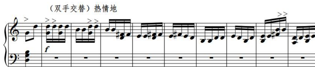
谱例 2-15: 《晓雾》第 177-205 小节