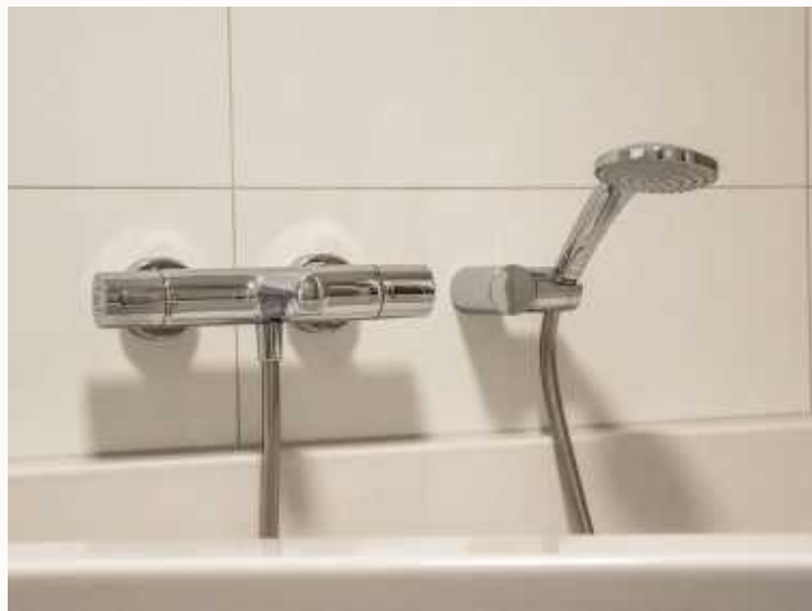
手动调节淋浴花洒

随着技术的进步，出现了手动调节的淋浴花洒，用户可以通过旋转或扳动开关来调节水流强度和温度。