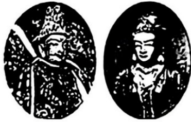
图3 松赞干布和文成公主塑像

(2)在第二主题“大交融”中，李红同学展示了图3、该图片反映的事件有什么影响?请你围绕本主题，在五代辽宋夏金时期的新疆历史中再挑选一件文物的图片，作为图4，写出文物名称并说明挑选的理由。(6分)