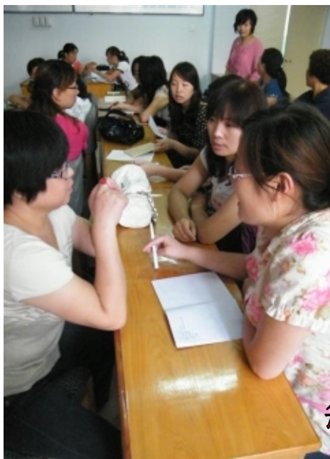
每一项工作都不能少