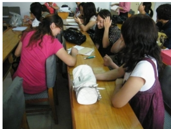
原来这样就能解决啊