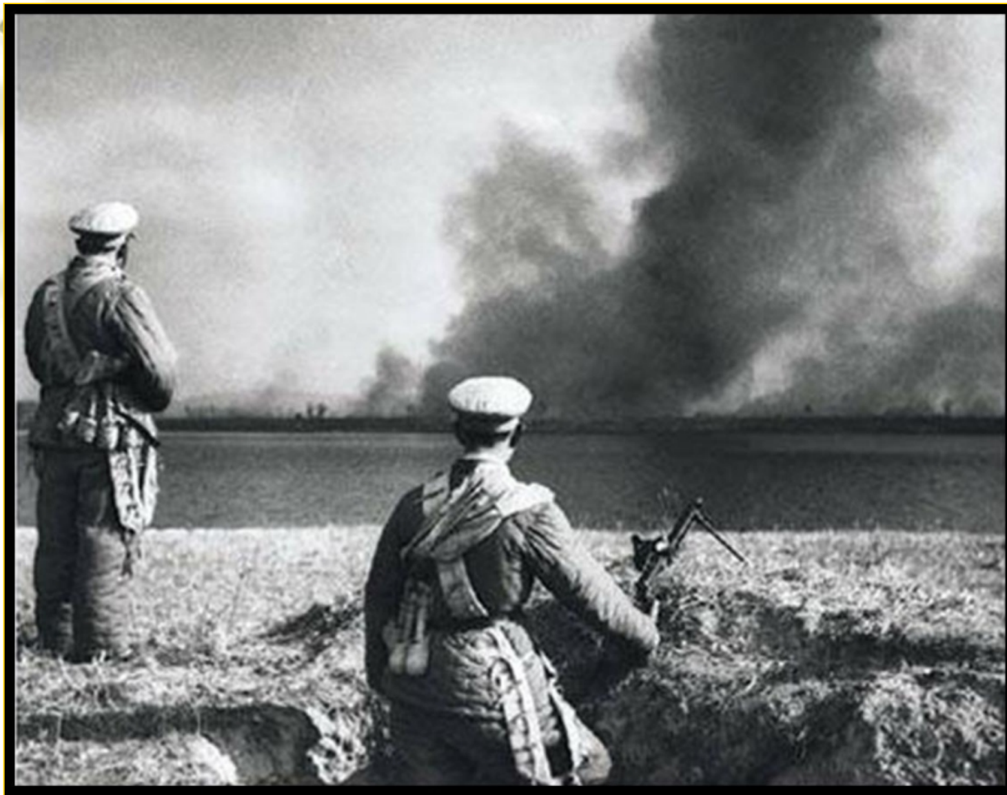
美军把战火烧到鸭绿江边