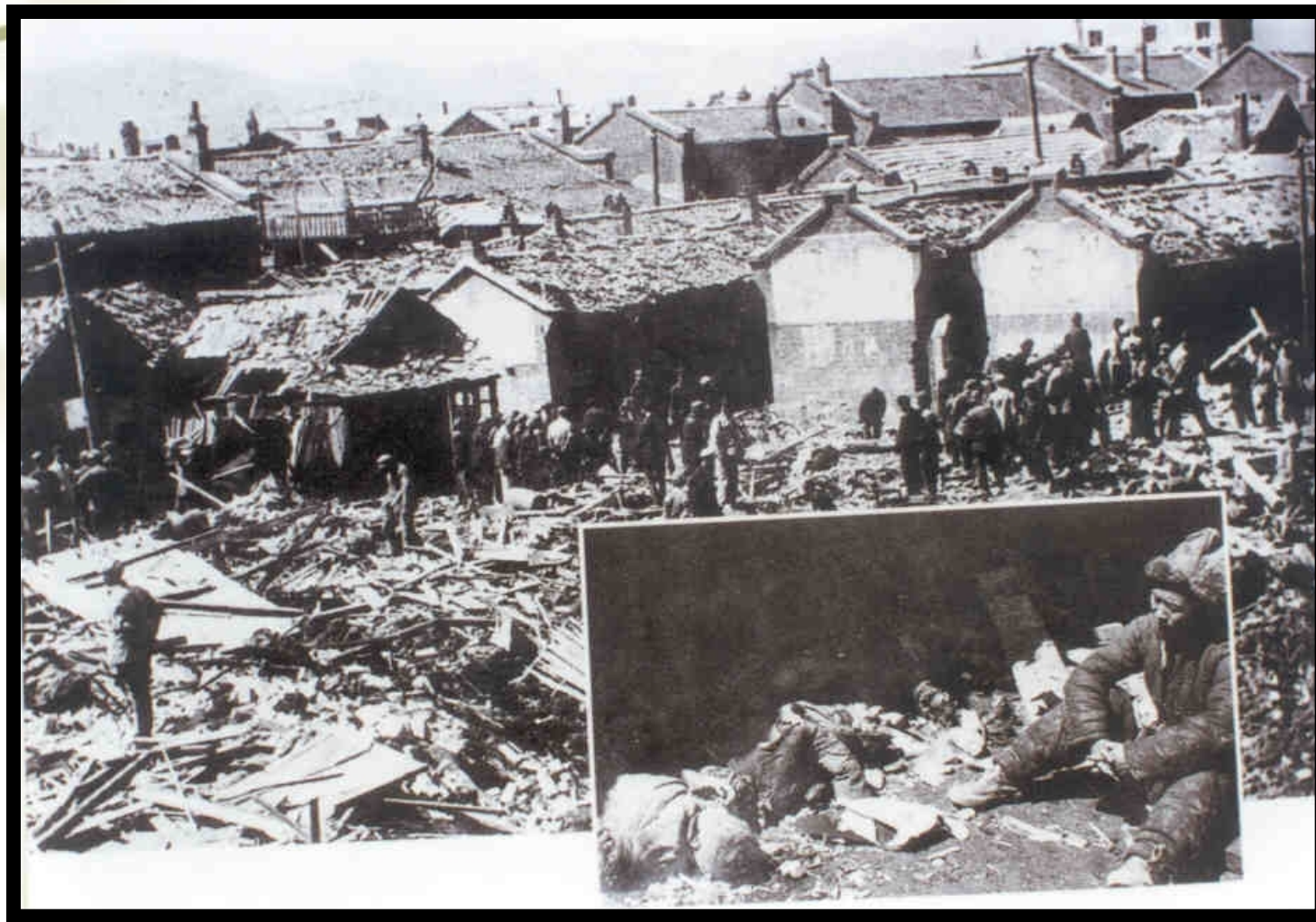
美国空军飞机对中国东北边境地区进行轰炸扫射。图为安东（今丹东）被炸一景