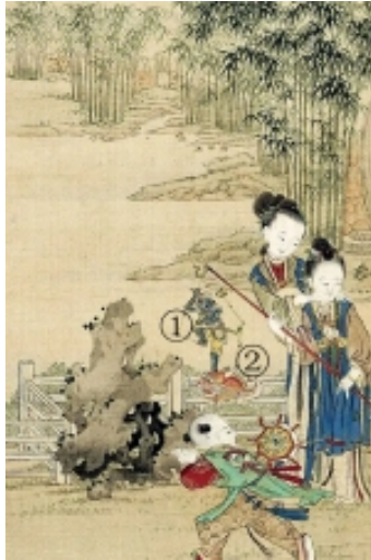
清代《升平乐事图》局部（注：①魁星②鳌）