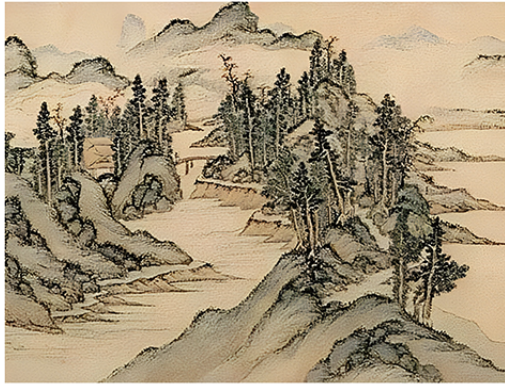
(明代 文伯仁《秋山游览图》)