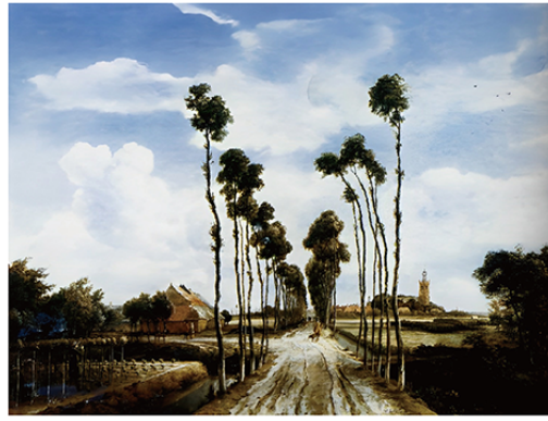
(荷兰 霍贝玛《林荫道》)

众所周知，中国画久已落得个不讲科学的名声，科学的是欧洲文艺复兴以来的焦点透视画。焦点透视法改变了绘画，绘画却不一定非要焦点透视不可，中国山水画放弃焦点透视，同样能够表现空间感。舍弃消失点的同时，中国绘画也发展出自己的透视法，有利于调和空间透视与时间移动，也有利于调和历时性与共时性。欧洲的焦点透视与中国的非焦点透视各有长短，要言之，焦点透视长于表现纵深的景深，拙于延续横向的时间流动。相反，中国式非焦点透视长于延续时间，不利于营造景深。或许可以这么说，焦点透视是一种倾向空间性的透视，中国式的非焦点透视是一种倾向时间性的透视，更精确地说，是一种时间与空间统一的透视法。