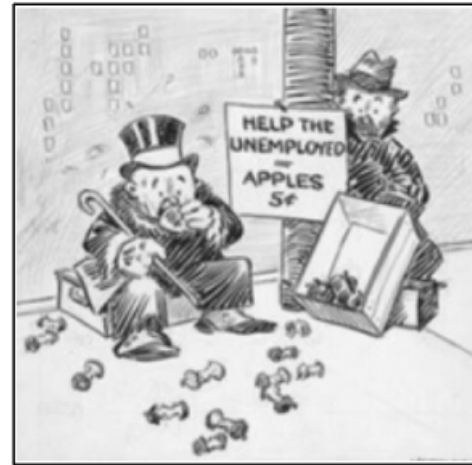
帮助失业者 苹果5美分 (注:招牌上的文字)