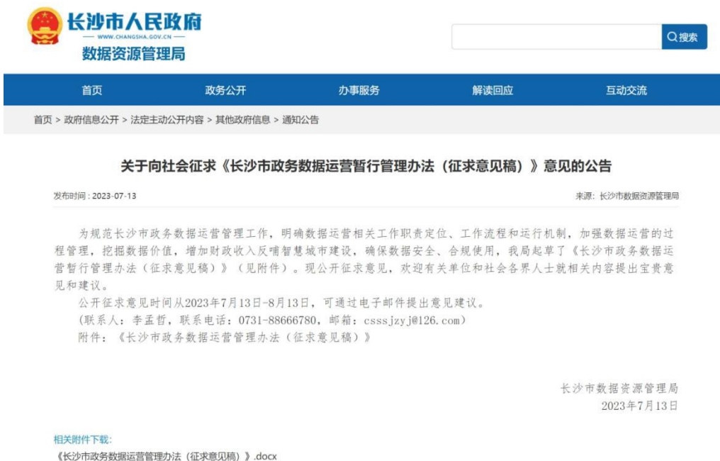
图 3：《长沙市政务数据运营暂行管理办法（征求意见稿）》公布