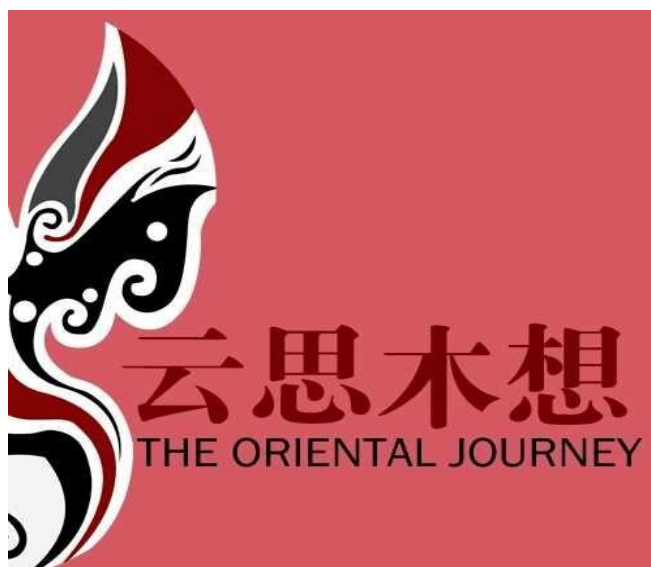
图 1-1 公司 Logo

广州慕紫服装有限公司成立于 2009 年，以“时尚中国风”为自主开发设计，是集设计、生产、销售集于一体的现代化服装公司，至今已经有十多年的历史，与 300 多家外国公司及工厂合作，产品已远销美国、英国、澳大利亚、日本等国家。“云思木想”电商品牌于 2013 年 9 月正式上线，开始原创之路，因独特的腔调与极好的口碑，迅速获得第一批中外忠实顾客的追捧，经验丰富的设计师团队，尤其擅长重工艺，用心打造每一件精品，他们不停的穿梭于米兰、东京、纽约、巴黎等时尚重地，捕捉国际最新的时尚信息和潮流趋势。