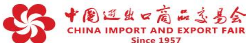
图 1-2 广交会 Logo

中国进出口商品交易会，又称广交会，创办于 1957 年秋，每年春秋两季在广州举办，由商务部和广东省人民政府联合主办，中国对外贸易中心承办。是中国目前历史最长、规模最大、商品种类最全、到会采购商最多且分布国别地区最广、成交效果最好、信誉最佳的综合性国际贸易盛会。