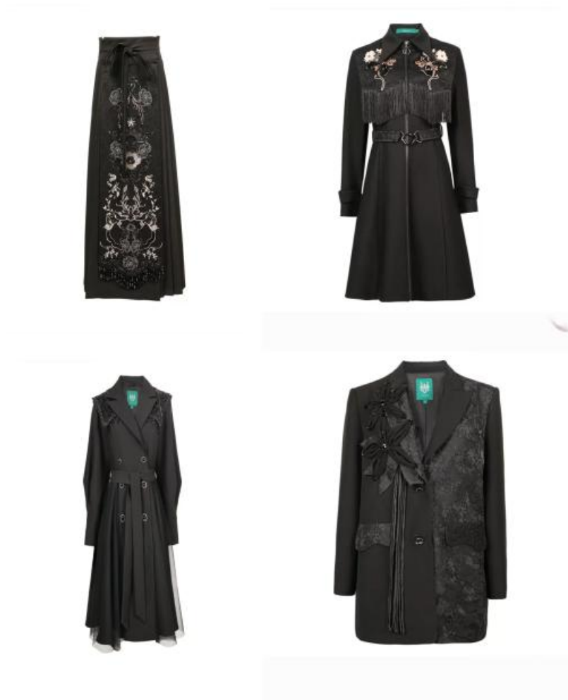
图 2-2 产品展示图