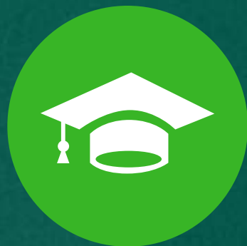
人本主义学习理论

行为主义学习理论强调环境刺激对行为改变的影响，它指导护理教育者设计基于奖励和惩罚的学习计划。