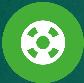
行为主义学习理论

学习理论是护理健康教育的基础，它解释了人们如何学习以及学习的过程。学习理论有助于理解学习者的需求，并指导护理教育者设计有效的学习策略。