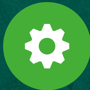
社会认知学习理论

人本主义学习理论强调人的主观能动性和自我实现的需求，它指导护理教育者关注学习者的个人成长和自我发展。