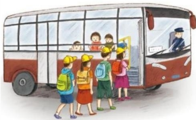
学生乘坐大巴去秋游