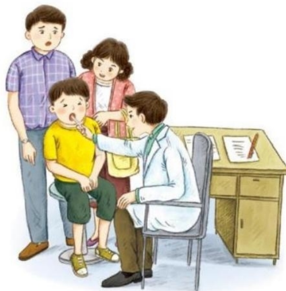
爸爸妈妈带孩子到医院看病