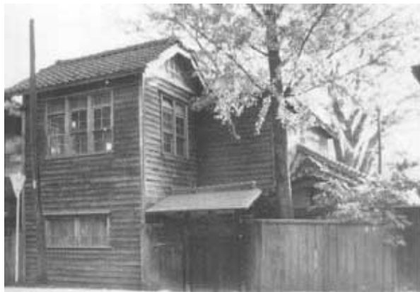
仙台医学专门学院