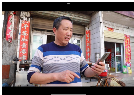
图 2—4 采访小吃店老板