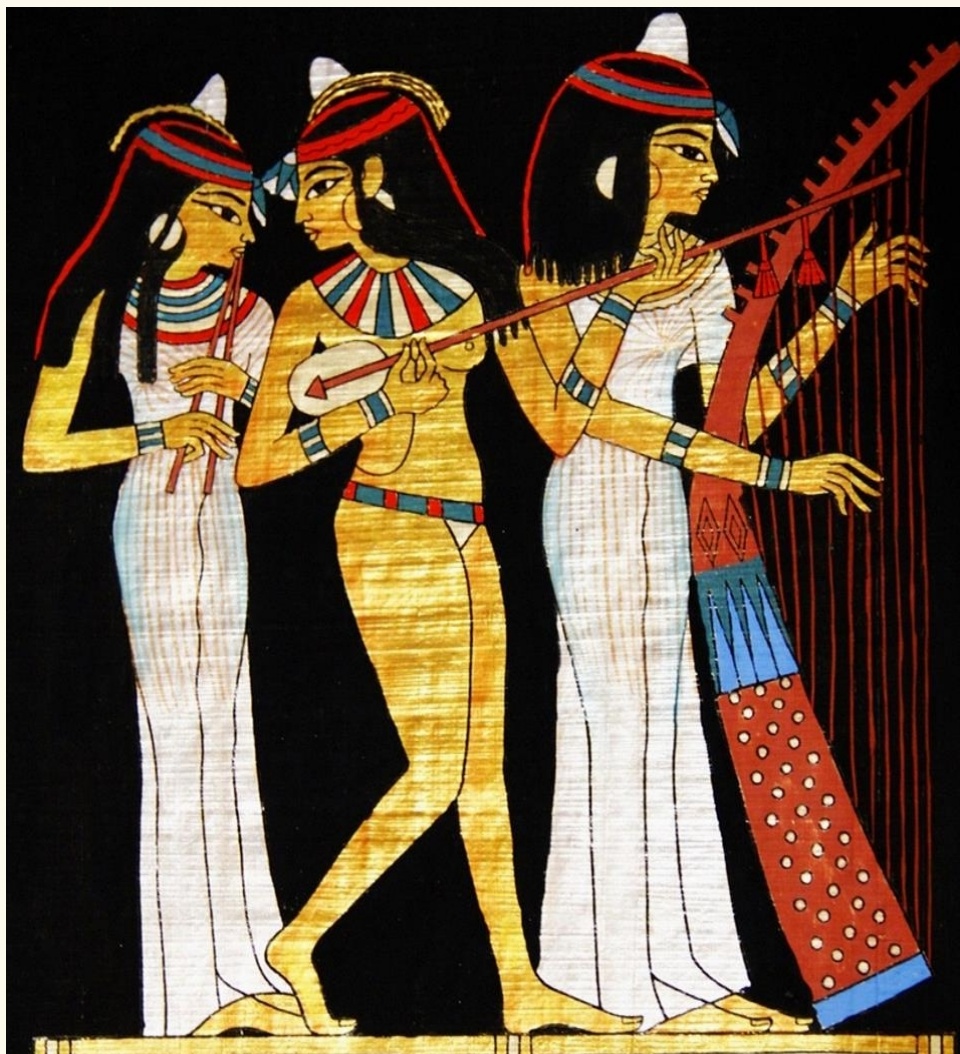
三个乐女——古埃及绘画(huìhuà)——正面律