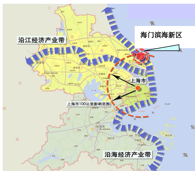
图 1-1 海门滨海新区区位图