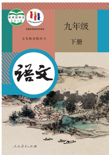
选自黄宾虹《渠河山色》