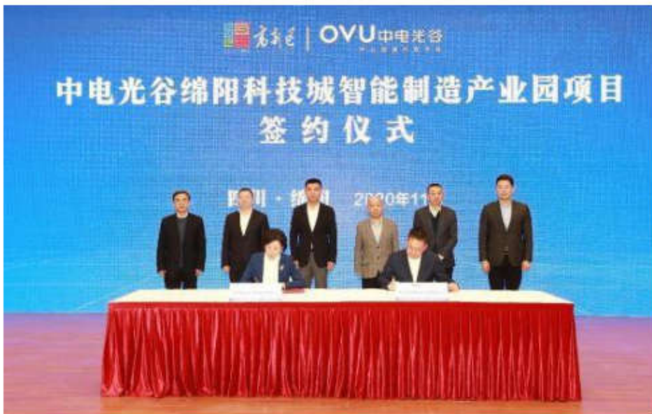
2020年11月项目签约，时任绵阳市委书记刘超、市长元方参加签约仪式。

中电光谷绵阳科技园由中国电子旗下中电光谷投资开发，是绵阳市重点招商引资项目、省市重大投资项目、央地合作示范项目。项目依托中国电子、中电光谷雄厚的资金链优势，统一规划，分期开发，厂房交付时间有保障、产权办理有保障，入园企业生产发展有保障、扶持政策有优势。