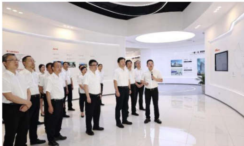
2023年9月，四川省委常委、绵阳市委书记曹立军带领绵阳市常委会成员考察调研中电光谷绵阳科技园项目，对园区产业组织、规划建设给予了充分肯定。