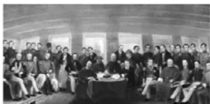
图1 1842年《南京条约》的签订情景