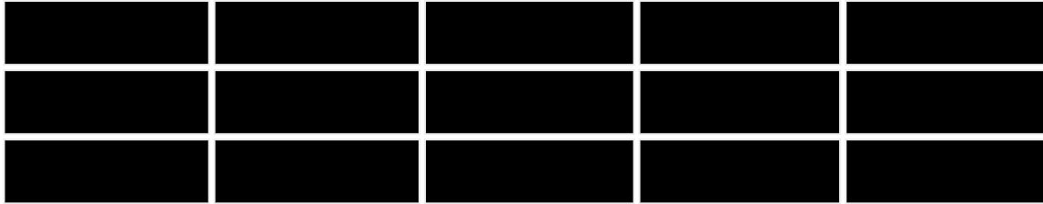
图1 医用敷料出口量数据折线图