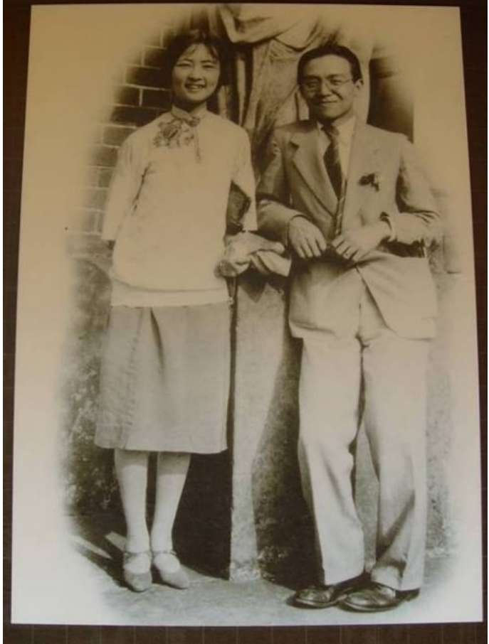
1928年林徽因与梁思成结婚

•林徽因，建筑学家和作家，为中国第一位女性建筑学家，被胡适誉为“ 中国一代才女 ”。她几乎标志着一一种时代的颜色，出众的才，倾城的貌，情感生活也像一种春天的童话，幸福而浪漫。感情世界里有三个男人，一种是梁思成，一种是诗人徐志摩，一种是学界泰斗、为她终身不娶的金岳霖。