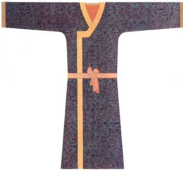
窄袖织纹衣穿戴展示图。