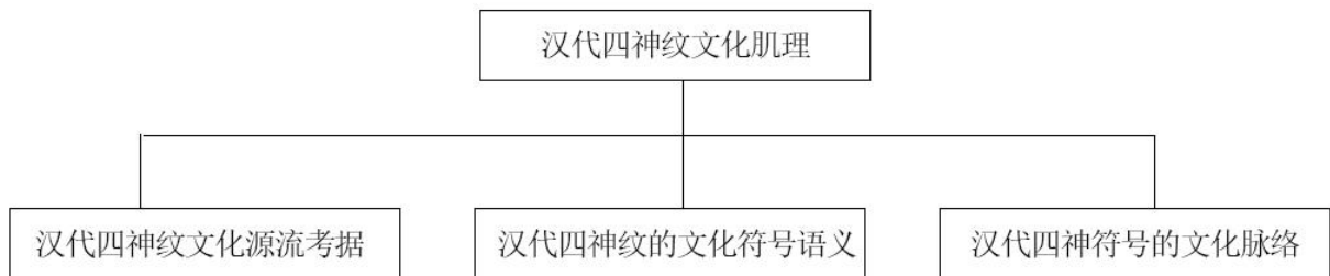
绪论表2 四神文化肌理梳理

本文通过对汉代四神纹文化源流考据、符号语义、文化脉络三部分梳理四神纹的文化肌理（绪论表2），立足符号学视角分析汉代四神纹，结合四神图像象符与语符双重编码性质，凸显四神纹符号语义特征，以期为当代设计实践提供新思路。