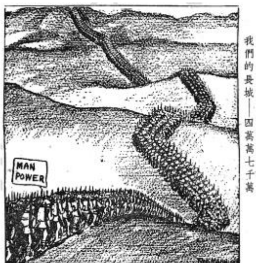
《我们的长城—四万万七千万》