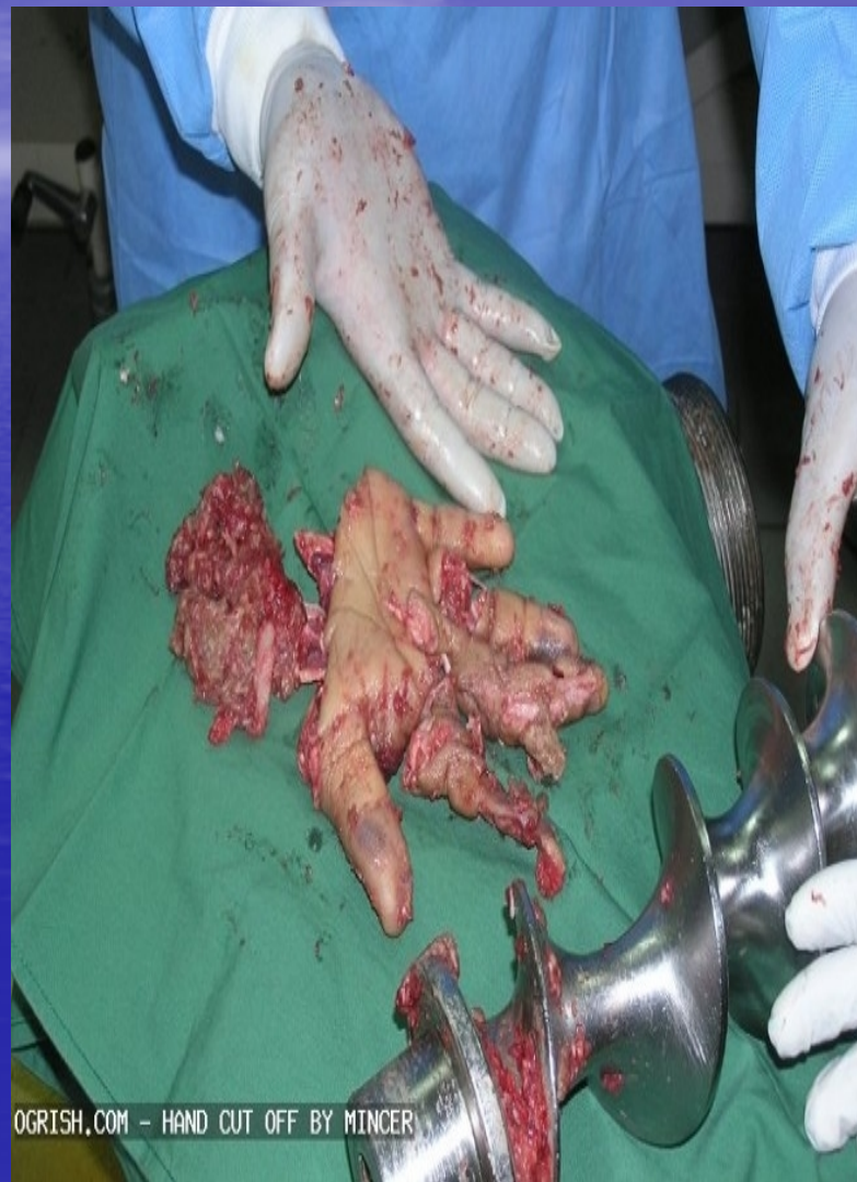
OGRISH.COM - HAND CUT OFF BY MINCER