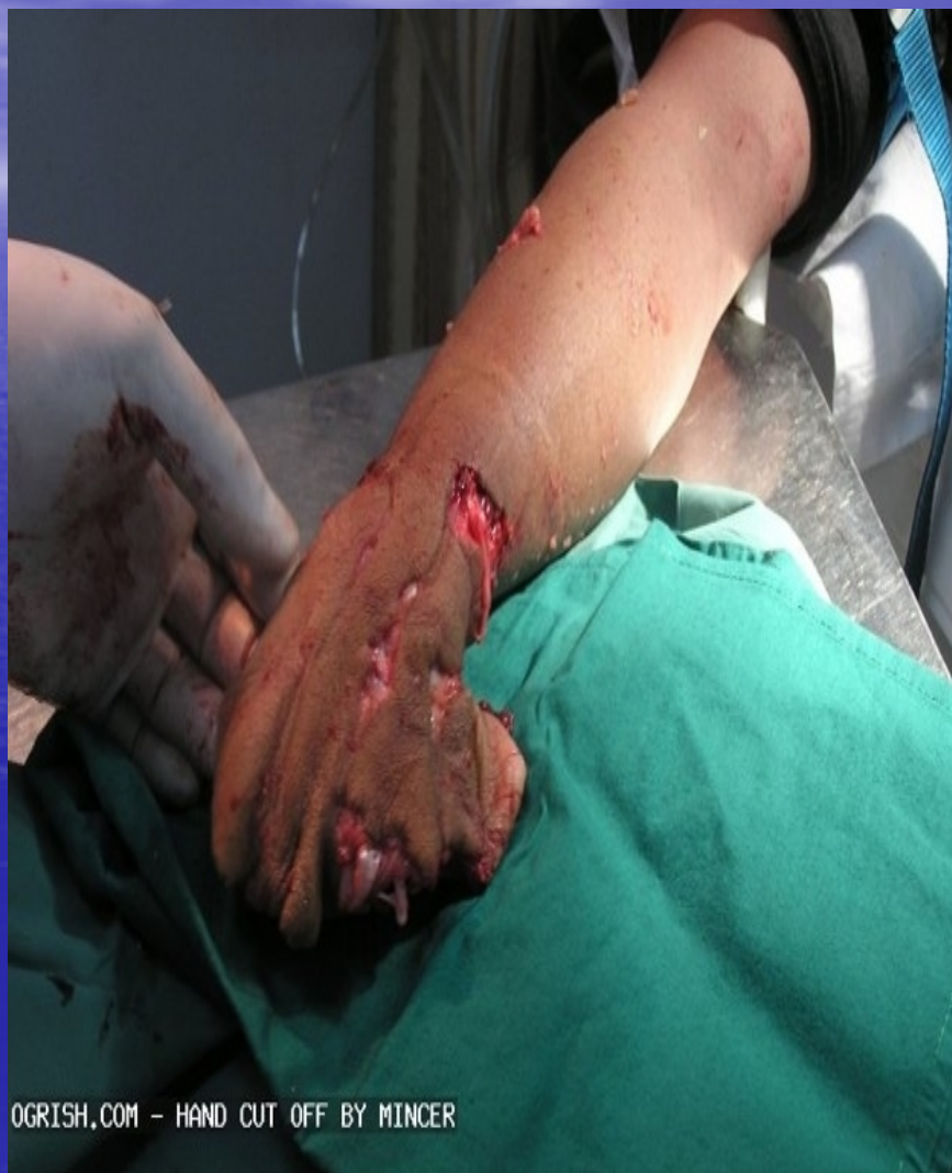
HAND CUT OFF BY MINCER