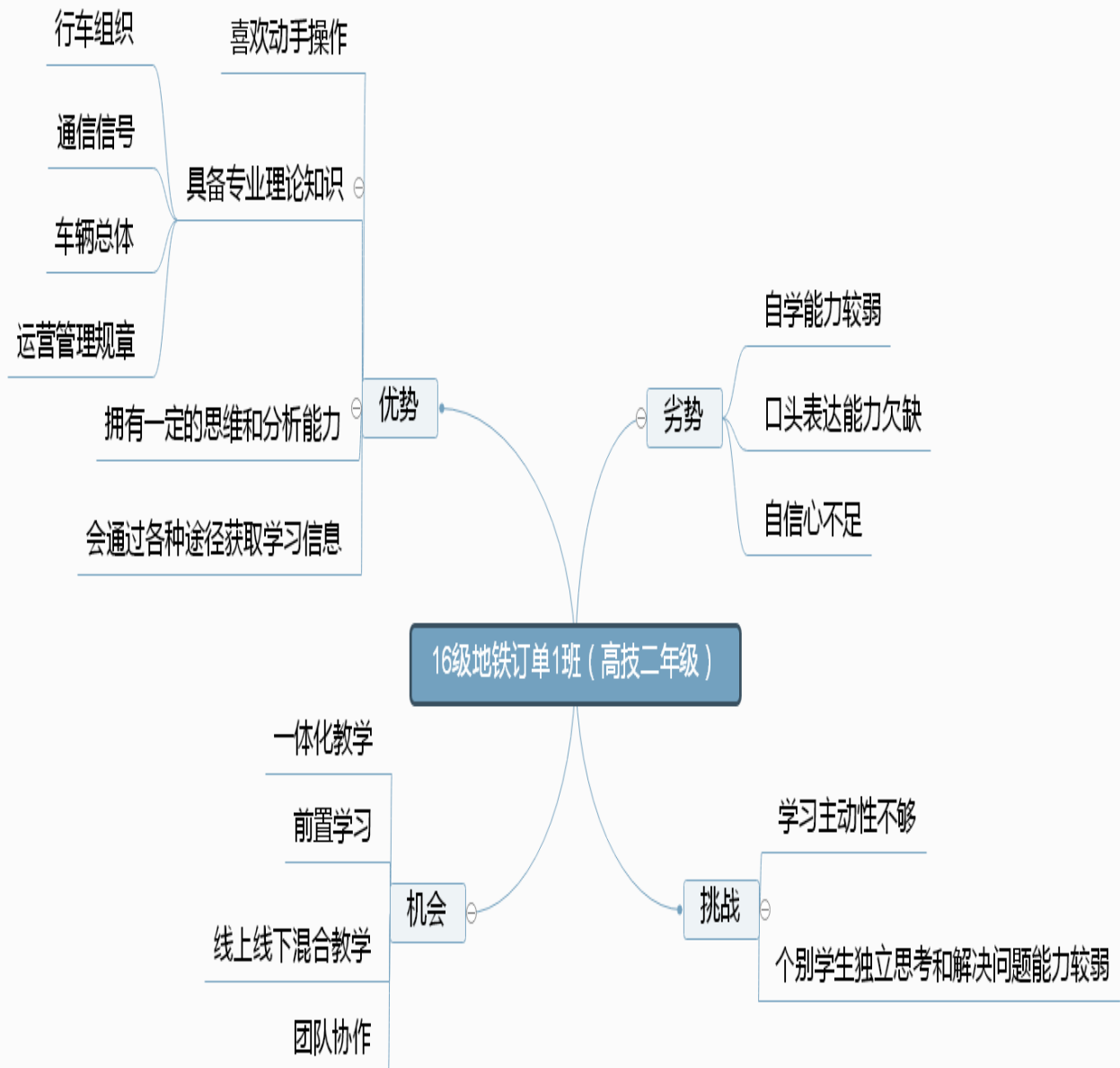
图 3 学情分析