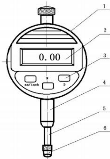
图 2 数显式指示表示意图