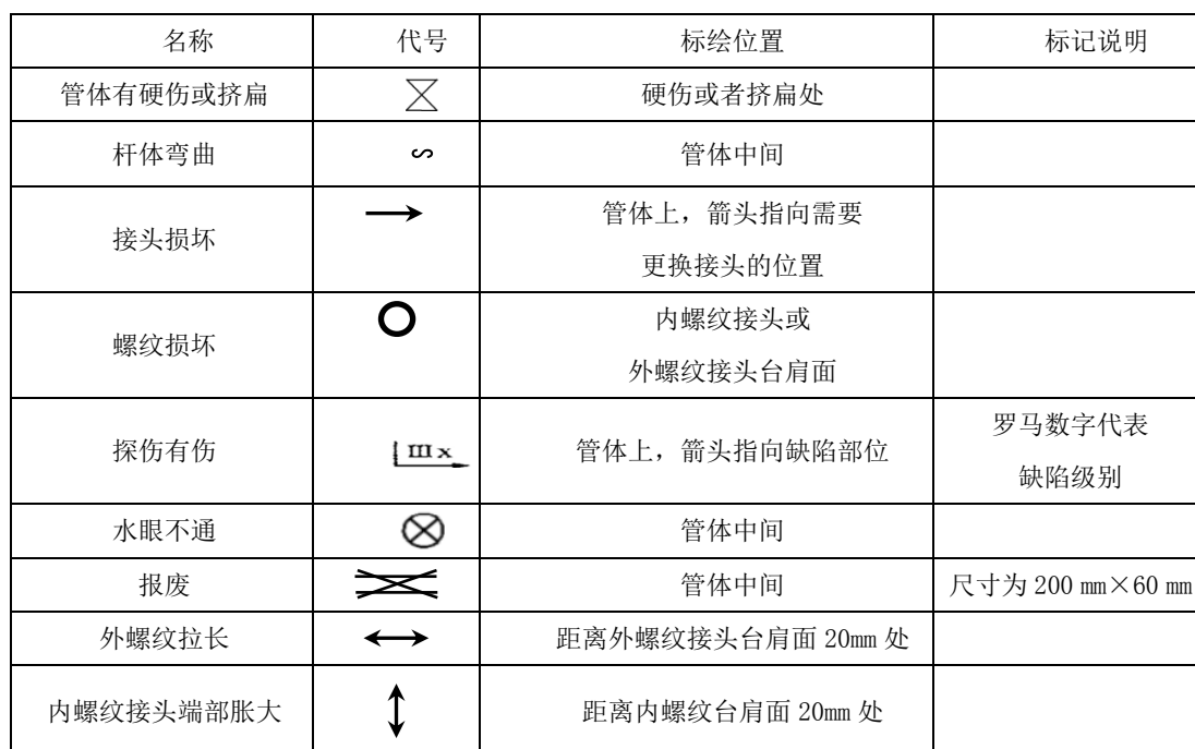
表8 钻杆缺陷标记代号