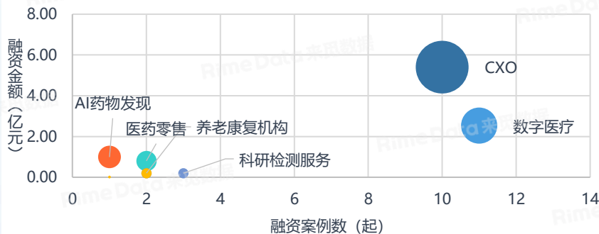
2024Q3中国医疗服务投融情况（融资金额&融资案例数）

注：其他医疗服务机构包含融资活跃度相对较低的血液透析中心、第三方体检机构、辅助生殖服务机构以及医院综合。