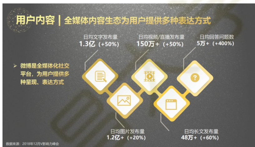
图 1.1 2018 年微博用户内容统计数据

CNNIC（中国互联网络信息中心）发布的第50次《中国互联网络发展状况统计报告》显示：中国的网民数量持续稳定增长，截至2022年6月，中国网民数量达到10.51亿，互联网普及率达到74.4% [1] 。随着互联网的普及，人们的衣食住行与互联网越来越密不可分，网络不仅仅是人们创造的一种工具，更是成为了一种生活环境。各类网络平台开始兴起，为随时随地的创造和分享内容创造了条件，人们在网络环境中进行着自我展示、表达和交流。自我表达是人们通过行为、语言等方式将自己的情感、思想和想法投射到外部的行为 [2] 。网络这个大环境，给人们提供了越来越多表达自我的社交网站。在新的媒介语境下，自我表达经常以新的媒介形式呈现出来 [3] ，人们可以通过更多样化的形式表达自己，例如表情包、音视频等。如图1.1所示，据2018年微博用户发展报告统计，微博每天平均有1.3亿的文字发布，发布图片量超1.2亿，视频直播日均发布量超过150万 [4] 。互联网时代，人们在网络环境中的表达无时无刻不在进行着。