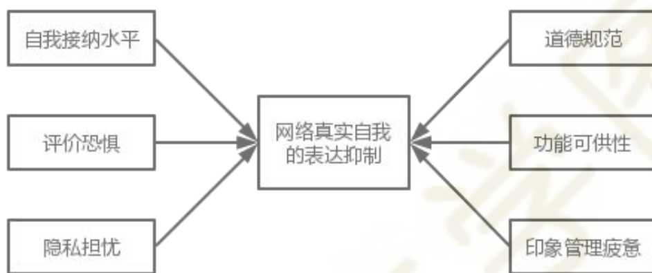
图 3.6 网络真实自我表达的抑制因素模型

选择式编码是用“故事线”将范畴联结起来进而形成理论模型的过程。通过不断的分析比较,以提炼出核心范畴,厘清各个范畴之间的逻辑关系,最终形成一条能够展现现象与行为的完整故事线。在此过程中,对主轴编码获得的范畴进行不断深入分析,最终确定核心范畴为“网络世界个体真实自我表达的抑制因素”,范畴间关系结构如图 3.6 所示: