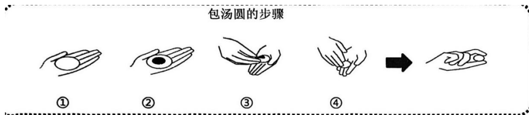
包汤圆的步骤说明

（2）汤圆是春节期间非常重要的传统美食，吃汤圆这一习俗寄托着人们对团圆的期盼。同学们想要学习包汤圆的方法。请你依据图示，将说明包汤圆步骤的文字补充完整，给同学们的实践操作提供帮助。（4分）